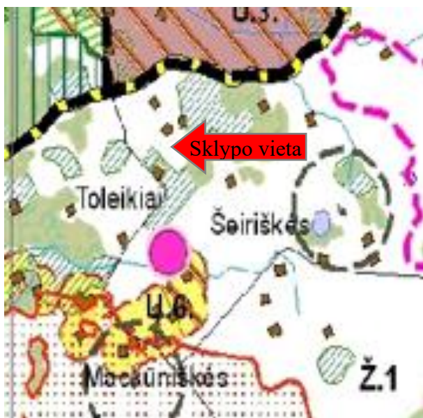
Elektrėnų savivaldybės bendrojo plano fragmentas