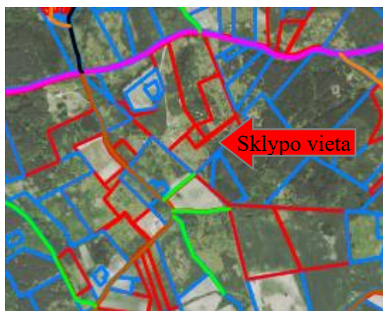
Vietinės reikšmės kelių schemos fragmentas