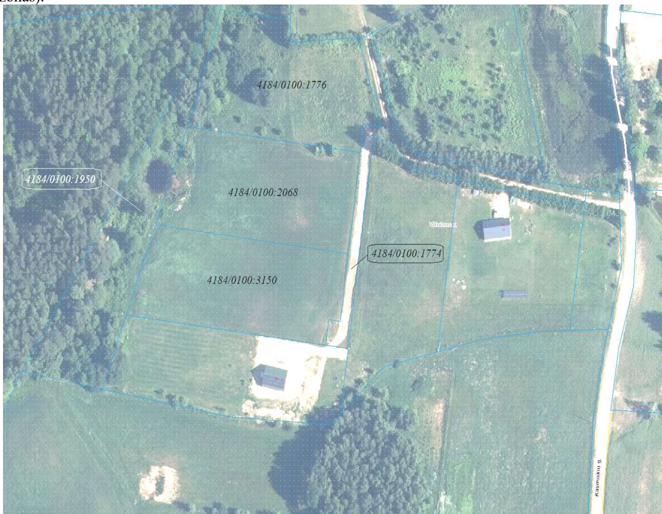
2 pav. Planinė žemės sklypo kad. Nr. 4184/0100:2068 padėtis

Žemės sklypas nepatenka į saugomas teritorijas (gamtos ir kultūros paveldo objektų ir jų apsaugos zonas).