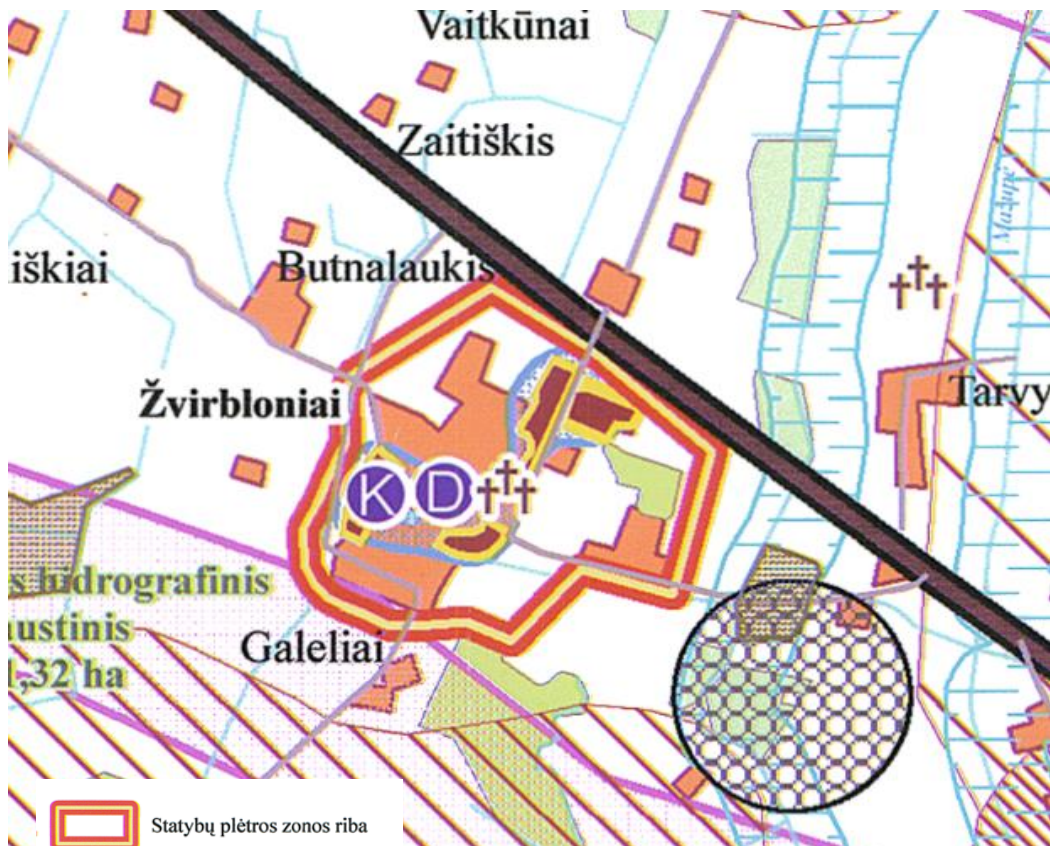
1 pav. Ištrauka iš savivaldybės bendrojo plano sprendinių

Pagal kaimo plėtros žemėtvarkos projektų rengimo taisyklių antrą punktą kaimo plėtros žemėtvarkos projektas yra vietovės lygmens specialiojo teritorijų planavimo žemėtvarkos dokumentas, rengiamas siekiant kaimo gyvenamųjų vietovių neurbanizuotose ir neurbanizuojamose teritorijose kompleksiskai suplanuoti žemės naudmenų sudėties pakeitimą, miško sodinimą, kitą su žemės ūkiu susijusią veiklą ir suformuoti žemės ūkio ir alternatyviosios veiklos subjektų žemės valdas. Vadovaujantis Pakruojo rajono savivaldybės teritorijos bendroju planu, teritorija patenka į statybų plėtros zonos ribą (urbanizuojama teritorija).