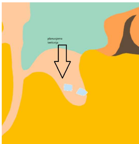
1 pav. Dirv_DR10Lt, vyraujančios dirvodarinės granulimetrinės sudėties duomenų bazės plano ištrauka

Dirvožemiai. Pagal dirvožemio granulimetrinę sudėtį žemės sklypą apima smėlingas lengvas priemolis (sp), vidutinio sunkumo priemolis (p1)(Dirv_DR10Lt, vyraujanti granulimetrinį sudėtis pagal n.Kacinskio metodą – www.geoportal.lt