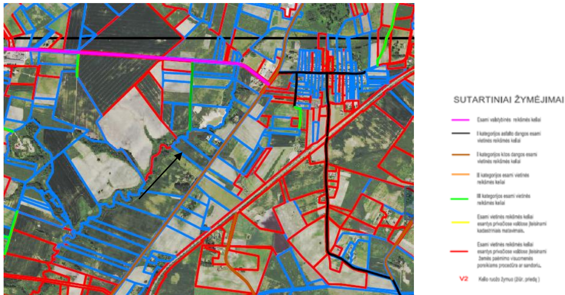
2 pav. Ištrauka iš Elektrėnų savivaldybės vietinės reikšmės kelių schemos Pertvarkoma teritorija ribojasi su I kategorijos vietinės reikšmės keliu.

Pagal Elektrėnų savivaldybės teritorijos bendrojo plano sprendinius, pertvarkomas sklypas patenka į žemės ūkio teritorijas, kuriose nerekomenduojamas miško įtvėsimas.