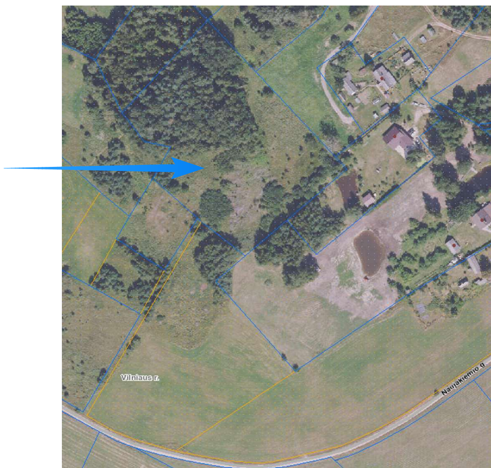
2pav. Planinė žemės sklypo padėtis