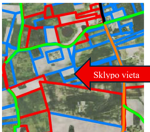
Vietinės reikšmės kelių schemos fragmentas