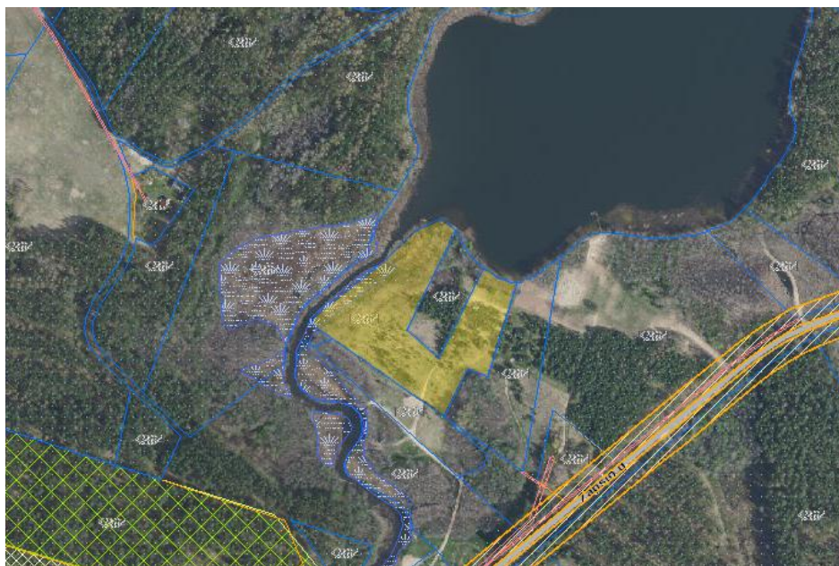
1 pav. Ištrauka iš RC žemėlapis

Kaimo plėtros žemėtvarkos projektas ūkininko sodybos vietai ir žemės ūkio veiklai reikalingų statinių statybos vietai parinkti rengiamas 2,0106 ha ploto žemės ūkio paskirties žemės sklypai, kurio kadastrinis Nr. 5918/0004:277. Sklypas yra Pazapsių kaime, Kučiūnų seniūnijoje, Lazdijų rajono savivaldybėje (1 pav.)