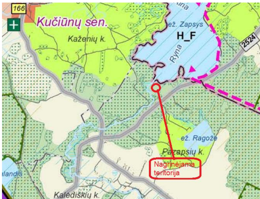
2 pav. Ištrauka iš Lazdijų r. sav. teritorijos bendrojo plano sprendinių konkretizavimo brėžinio

Žemės sklypo Kad. Skl. Nr. 5918/0004:277 vieta nagrinėjama Lazdijų rajono savivaldybės teritorijos bendrajame plane, patvirtintame Lazdijų rajono savivaldybės tarybos 2023-10-12 sprendimu Nr. 5TS-151. Pateikiama ištrauka iš sprendinių konkretizavimo brėžinio. Nagrinėjama teritorija patenka į neurbanizuojamą teritoriją, MI_F – miškų ir miškingų teritorijų zona. Dominuoja miškų ūkio paskirties žemė. Kitos: konservacinės paskirties žemė, vandens ūkio paskirties žemė, žemės ūkio paskirties žemė, kitos paskirties žemė. Taip pat pertvarkomas sklypas patenka į planuojamo gamtinio karkaso teritoriją (migracijos koridoriai) (2 pav.)