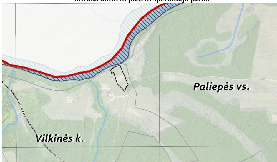
Ištrauka iš Vilniaus rajono savivaldybės vandens tiekimo ir nuotekų tvarkymo infrastruktūros plėtros specialiojo plano

Išnagrinėjus Vilniaus rajono savivaldybės vandens tiekimo ir nuotekų tvarkymo infrastruktūros plėtros specialųjį planą, žemės sklypas nepatenka į Viešojo vandens tiekimo teritorijos ir vandentvarkos infrastruktūros jose plėtros prioritetus.