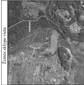
Žemės sklypo vieta