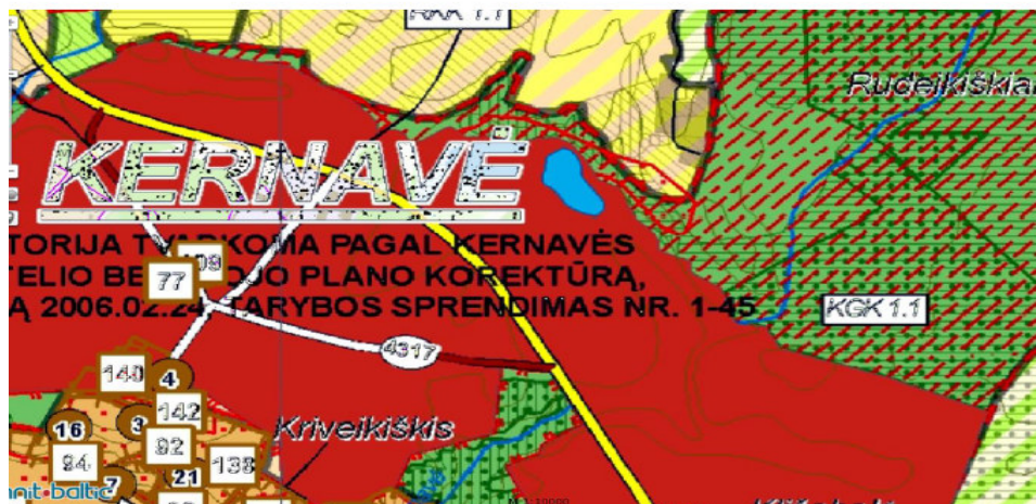
2 pav. ištrauka iš Širvintų rajono savivaldybės teritorijos kraštovaizdžio tvarkymo specialiojo plano