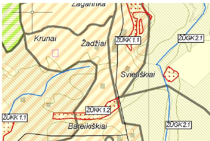
2 pav. Ištrauka iš Širvintų rajono savivaldybės teritorijos kraštovaizdžio tvarkymo specialiojo plano patvirtinto 2015-02-18

kompaktiška statyba teritorijose išskyrus gamtinių ir kultūrinių požiūriu saugomas teritorijas, bendru atveju – išskyrus įsteigtas saugomas teritorijas. Į gamtinį karkasą įeinančiose teritorijose gyvenamųjų sodybų išdėstymas turi neprieštarauti „Gamtinio karkaso nuostatams“ (aktuali redakcija).