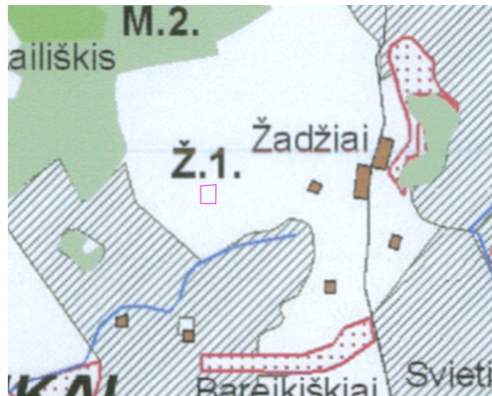
1 pav. Ištrauka iš Širvintų rajono savivaldybės teritorijos bendrojo plano patvirtinto 2009-05-29

Vadovaujantis šio plano žemės naudojimo ir apsaugos reglamentų brėžiniu nustatyta, kad žemės sklypas patenka į žemės ūkio teritoriją Ž.1. , kurioje pagrindiniai naudojimo būdai ir pobūdžiai yra: Žemės ūkio, miškų, ūkio, vandens, Kitos paskirties (inžinerinės infrastruktūros, susisiekimo, namų grupės ir pavieniai statiniai, turizmo, rekreaciniai, viešos paskirties. Šioje zonoje nerekomenduojama urbanistinė plėtra, galimos esamų perspektyvių sodybų, jų priklausinių, žemės ūkio pastatų ir kompleksų modernizavimas, nauja statyba.