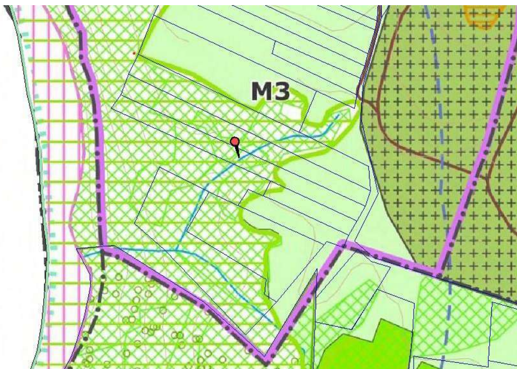
1 pav. Ištrauka iš Vilniaus rajono savivaldybės teritorijos kraštovaizdžio specialiojo plano

Pagal Vilniaus rajono savivaldybės tarybos 2014 m. gruodžio 17 d. sprendimu Nr. T3-571 patvirtintą Vilniaus rajono savivaldybės teritorijos kraštovaizdžio specialųjį planą, planuojamo žemės sklypo teritorija, dalinai patenka į miškų ūkio teritorijų kraštovaizdžio tvarkymo zoną (M3 – apsauginių miškų), dalinai į teritoriją kurioje reglamentinė zona nenustatyta (1 pav.).