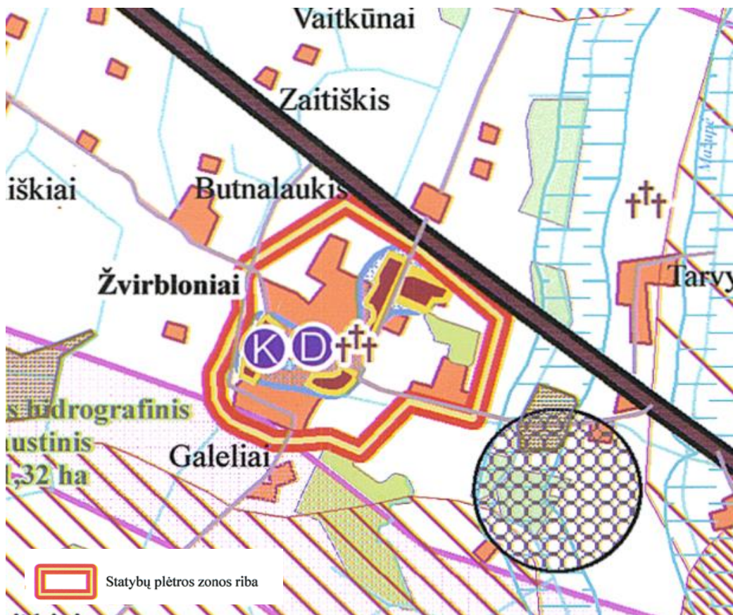
1 pav. Ištrauka iš savivaldybės bendrojo plano sprendinių

Vadovaujantis Pakruojo rajono savivaldybės teritorijos bendruoju planu teritorija patenka į statybų plėtros zonos ribą,