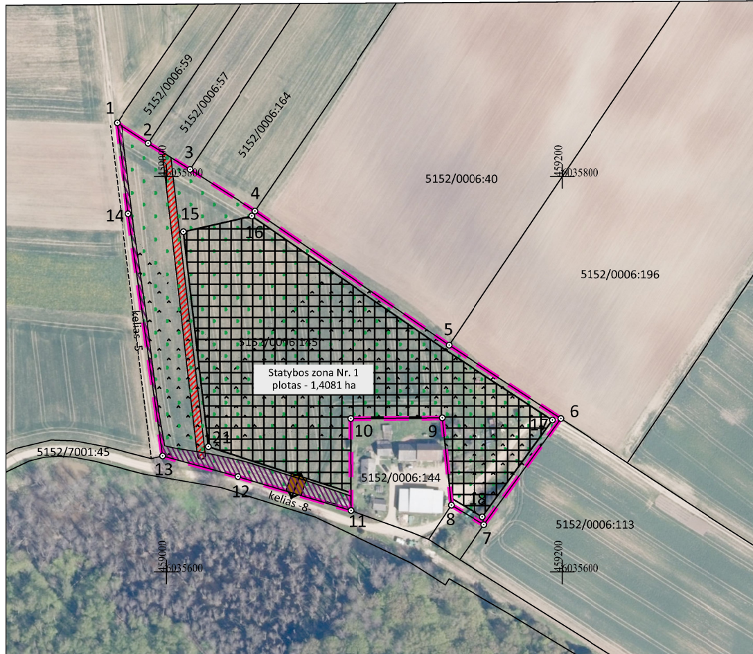
Statinių statybos vietos pėsčiųjų taškų koordinatės