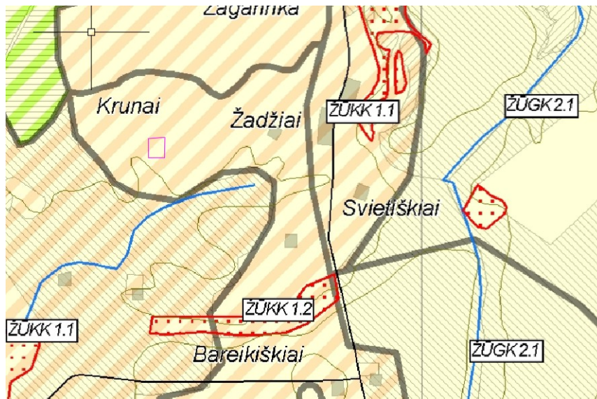
2 pav. Ištrauka iš Širvintų rajono savivaldybės teritorijos kraštovaizdžio tvarkymo specialiojo plano patvirtinto 2015-02-18

kompaktiška statyba teritorijose išskyrus gamtinių ir kultūrinių požiūriu saugomas teritorijas, bendru atveju – išskyrus įsteigtas saugomas teritorijas. Į gamtinį karkasą įeinančiose teritorijose gyvenamųjų sodybų išdėstymas turi neprieštarauti „Gamtinio karkaso nuostatams“ (aktuali redakcija).