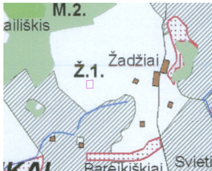
1 pav. Ištrauka iš Širvintų rajono savivaldybės teritorijos bendrojo plano patvirtinto 2009-05-29

Vadovaujantis šio plano žemės naudojimo ir apsaugos reglamentų brėžiniu nustatyta, kad žemės sklypas patenka į žemės ūkio teritoriją Ž.1. , kurioje pagrindiniai naudojimo būdai ir pobūdžiai yra: Žemės ūkio, miškų, vandenių, Kitos paskirties (inžinerinės infrastruktūros, susisiekimo, namų grupės ir pavieniai statiniai, turizmo, rekreaciniai, viešos paskirties. Šioje zonoje nerekomenduojama urbanistinė plėtra, galimos esamų perspektyvių sodybų, jų priklausinių, žemės ūkio pastatų ir kompleksų modernizavimas, nauja statyba.