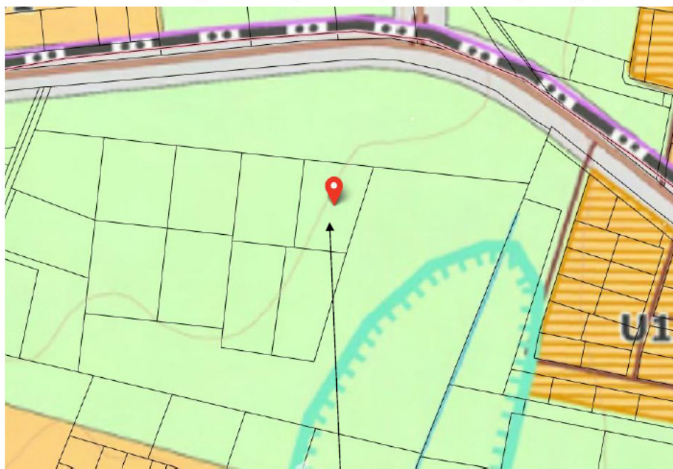
Ištrauka iš Vilniaus rajono savivaldybės teritorijos kraštovaizdžio specialiojo plano

4) ūkio šakų plėtros programų ir strateginių dokumentų nuostatos bei sąlygas išduodančių institucijų kompetencijai priskirti reikalavimai: jeigu numatomos ūkinės veiklos rūšis yra įrašyta į Planuojamos ūkinės veiklos poveikio aplinkai vertinimo įstatymo (Žin., 2005, Nr. 84-3105) 1 arba 2 priedo sąrašus, pirmiausia reikia atlikti poveikio aplinkai vertinimo procedūras.