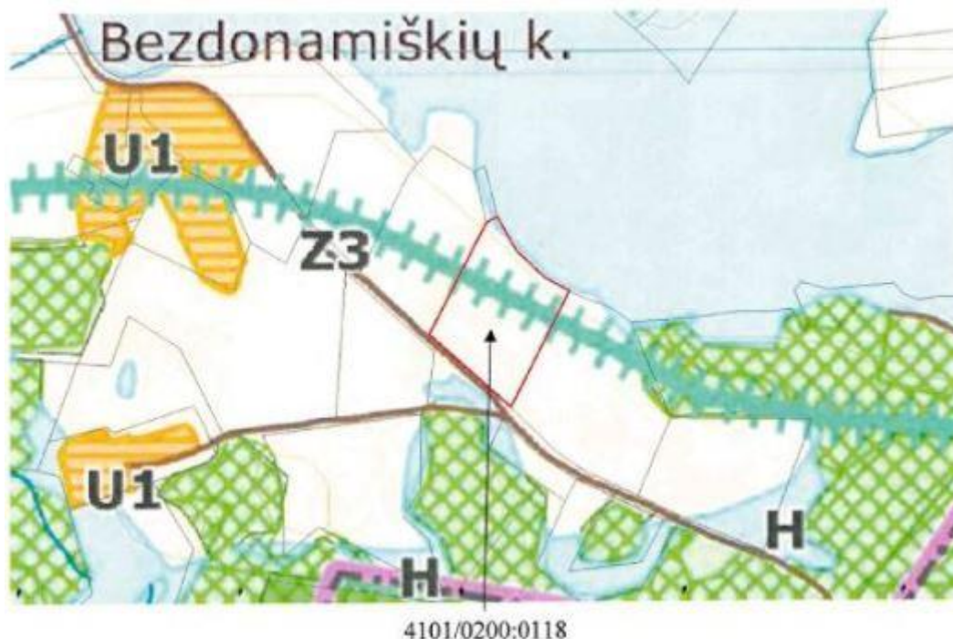
1pav. Ištrauka iš Vilniaus rajono savivaldybės teritorijos kraštovaizdžio specialiojo plano

Vadovaujantis Vilniaus rajono savivaldybės teritorijos kraštovaizdžio specialiuoju planu, patvirtintu Vilniaus rajono savivaldybės tarybos 2014-12-17 sprendimu Nr. T3-571, nagrinėjamas žemės sklypas patenka į Z3- intensyvaus ūkininkavimo zoną.