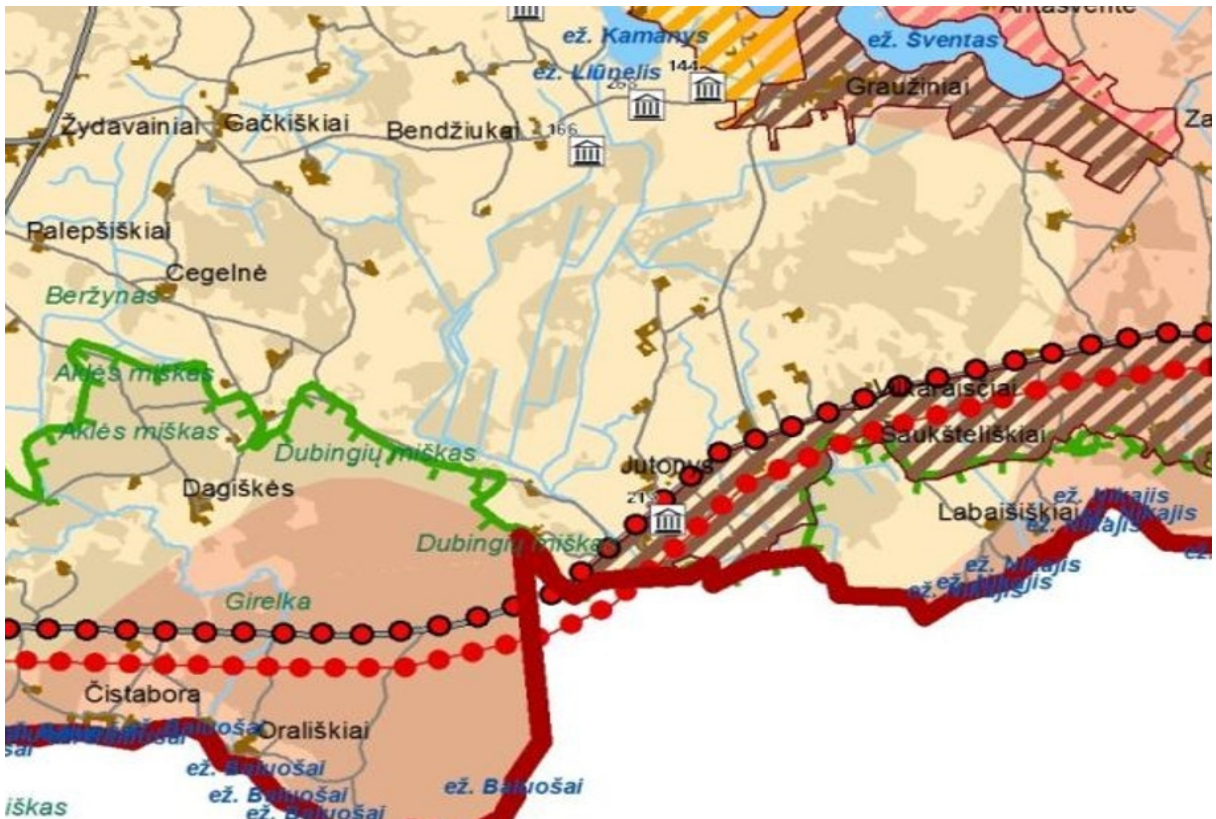
4 pav. Ištrauka iš Molėtų rajono rekreacinių vietovių specialiojo plano rekreacijos, turizmo, gamtos ir kultūros paveldo plėtojimo brėžinio