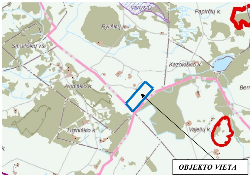
3 pav. Ištrauka iš Utenos rajono vandens tiekimo ir nuotekų tvarkymo specialiojo plano ( www.planuojustatau.lt )

Vadovaujantis Utenos rajono vandens tiekimo ir nuotekų tvarkymo infrastruktūros plėtros specialiuoju planu, patvirtintu 2022-03-24 Utenos rajono savivaldybės tarybos sprendimu Nr. TS-94), projektuojama teritorija nepatenka į Utenos rajono vandens tiekimo ir nuotekų tvarkymo infrastruktūros plėtros teritorijas.