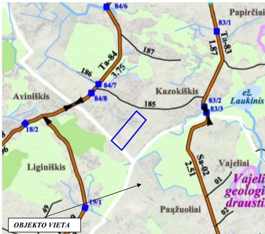
2 pav. Ištrauka iš Utenos rajono kelių tinklo specialiojo plano ( www.planuojustatau.lt )

Vadovaujantis Utenos rajono vandens tiekimo ir nuotekų tvarkymo infrastruktūros plėtros specialiuoju planu, patvirtintu 2022-03-24 Utenos rajono savivaldybės tarybos sprendimu Nr. TS-94), projektuojama teritorija nepatenka į Utenos rajono vandens tiekimo ir nuotekų tvarkymo infrastruktūros plėtros teritorijas.