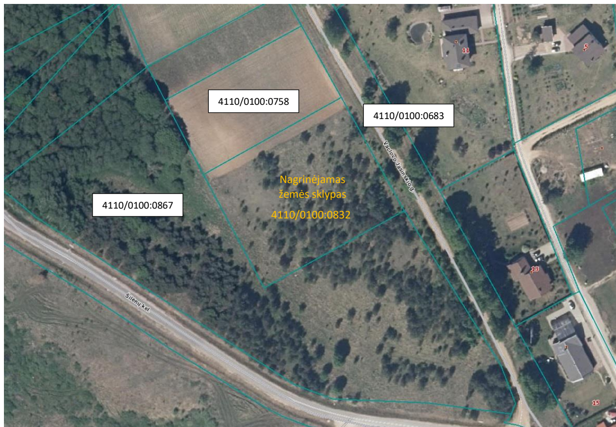
1 pav. Nagrinėjamos teritorijos gretimybių schema

Nagrinėjamam Žemės sklypui nebuvo nustatyti nekilnojamojo kultūros paveldo ar valstybės saugomų objektų ir teritorijų apribojimai.